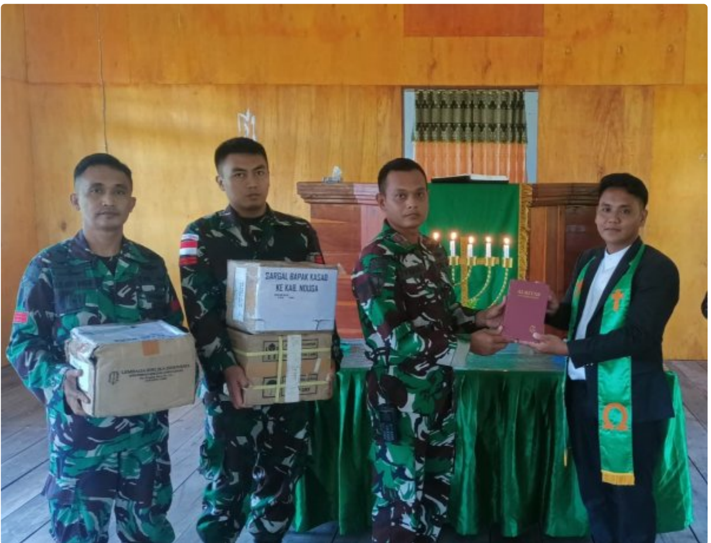
Foto: Satgas Yonif 503/Mayangkara kembali menunjukkan dedikasinya kepada masyarakat di Papua dengan memberikan dukungan alat musik untuk kegiatan ibadah di Gereja GKI Bethesda Batas Batu, Distrik Krepkuri, Kabupaten Nduga. Pada Minggu, 12 Januari 2025.

NDUGA- Satgas Yonif 503/Mayangkara kembali menunjukkan dedikasinya